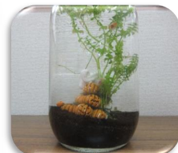
事務所のミニ水槽

当協会のインスタグラムの公式アカウントはまだございませんが、やわらかい話題の近況をお知らせすべく、こちらのニュースレターにて「インスタ的な」のコーナーを始めた次第です。どうぞ末永くご愛顧ください。