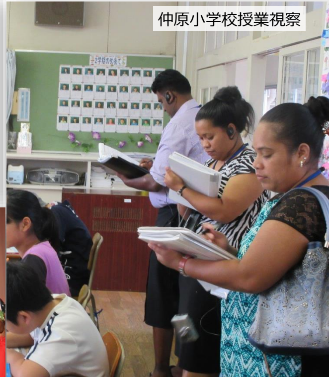
仲原小学校授業視察