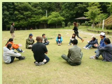
海外の森遊び、次は誰が鬼かな?!