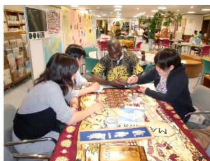
ボードゲーム「アワレ」に夢中の参加者