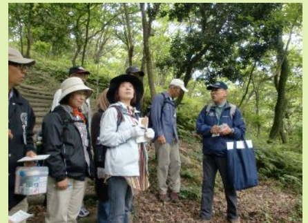
新しい発見がいっぱいの森林散策