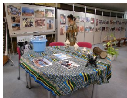
青年海外協力隊活動写真の展示