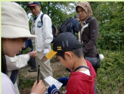
フィールドビンゴに熱心に取り組む子供