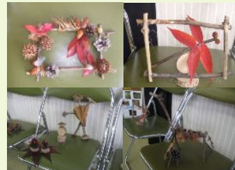
参加者の個性豊かな作品