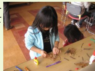
どんぐりや枝を使って名札づくり