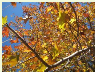
なんとか紅葉に間に合いました