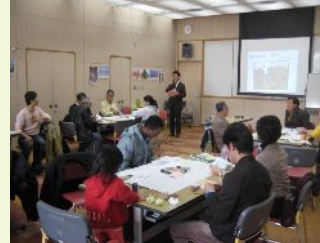
11月22日お話し会の様子