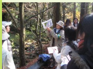
レンジャーによる森林散策