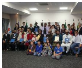
閉校式での記念撮影