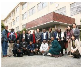
福浜小学校校門前