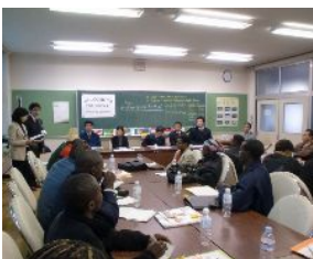
飯塚市立庄内中学校 教員とのディスカッション

1月29日～2月10日までの13日間、アフリカ9カ国から小・中・高等学校の教員が来福し研修を行った。今回の研修の目的は、理科や算数・数学の授業法の習得であった。小・中・高等学校では、理科や数学の授業を参観しながら、授業の進め方、生徒への指導法、黒板の使用法や理科実験方法など多くのことを学んだ。科学館や博物館では、セカンダリースクールとしての役割や教育機関との連携事例などを学んだ。2月7日のホームビジットでは、1家族1～2名の研修員を受入れてもらい心のこもった交流が行われました。研修員は、この研修で学んだことを本国で活かしてくれると信じています。最後にこの研修にご協力頂きました関係者の皆様、本当にありがとうございました。 齊藤